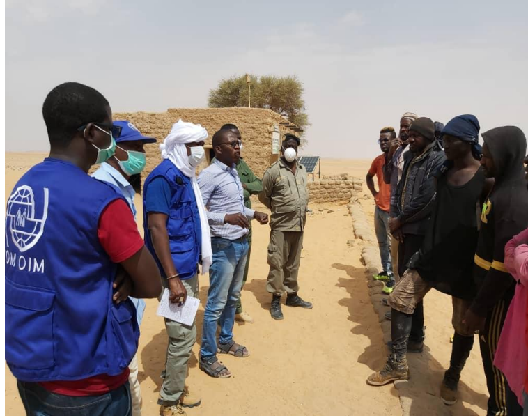
Mission à Assamaka de l'OIM et autorités locales pour sensibiliser les retournés de l'Algérie et les migrants en détresse par rapport aux nouvelles mesures de confinement obligatoire

2 maisons de passage nouvellement louées à Niamey suite à la fermeture des frontières