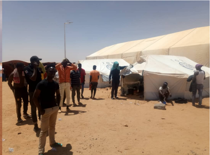
Site des rapatriés Nigériens à Agadez qui sert de site d'isolement obligatoire

NATIONAL : L’OIM continue de travailler avec les autorités nigériennes, les pays d’origine et les Ambassades des pays tiers présentes au Niger en faveur de l’ouverture d’un couloir humanitaire pour le retour volontaire des migrants qui ne présentent aucun symptôme de COVID-19 et qui ont déjà séjourné plus de 14 jours dans les centres de transit pour les migrants de l’OIM au Niger-