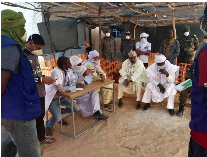
Réunion à Assamaka de l'OIM, DRSP (Agadez) et autorités locales pour discuter les mesures en place liées au COVID-19 et leur mise en œuvre dans la région

ASSAMAKA : L'OIM en collaboration avec Médecins Sans Frontières (MSF) continue d'appuyer le Gouvernement du Niger avec le volet de quarantaine à Assamaka. L'OIM a renforcé la capacité d'accueil de son site afin de pouvoir héberger les 764 personnes concernées pour 14 jours à partir du 18 mars 2020 (2 jours avant la fermeture des frontières le 20 mars 2020 au Niger), sachant que le lieu était auparavant un site de transit (24 heures max.). L'OIM assure la provision de nourriture, eau et kits de bien non alimentaires et autres kits de dignité. Il est à noter que des petits groupes continuent d'arriver en provenance d'Algérie et qu'il devient de plus en plus compliqué de mettre ces derniers en quarantaine.