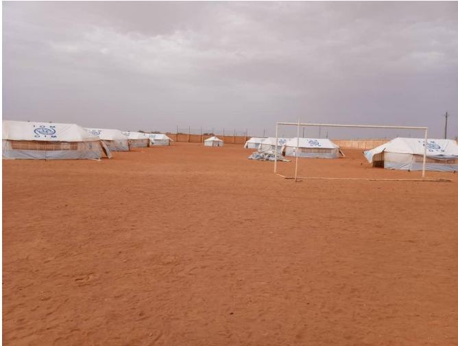
Site de quarantaine provisoire sur le stade de football à Arlit

AGADEVZ : L’OIM assiste actuellement plus de 800 migrants dans son centre de transit d’Agadez. En parallèle, l’OIM continue d’appuyer le Gouvernement du Niger à Agadez après que ce dernier ait décidé de convertir le site des rapatriés nigériens en site de quarantaine. Actuellement, le site géré par la DRSP d’Agadez et le comité COVID-19 permet d’assister un peu plus de 230 migrants, principalement de nationalités tierces. Pareillement, l’OIM prête assistance à travers la location de hangars, la provision de nourriture, eau et kits de bien non alimentaires.