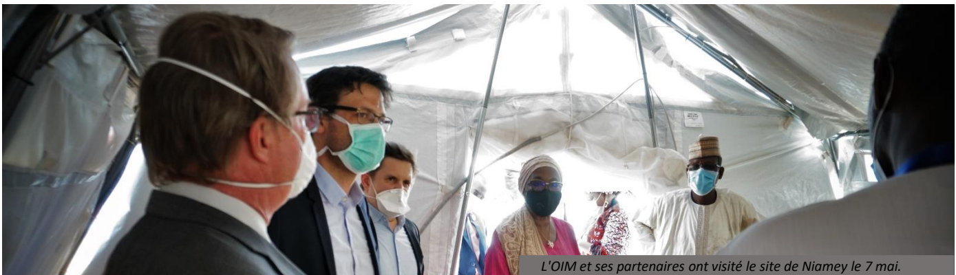
L'OIM et ses partenaires ont visité le site de Niamey le 7 mai.

Au poste frontalier de Dan Issa, dans la région de Maradi, le point de contrôle des flux de l'OIM a observé le retour de 400 Nigériens du Nigeria entre le 23 et le 27 avril. Après avoir été testés négatifs au COVID-19, ils ont été autorisés à retourner dans leur communauté d'origine.