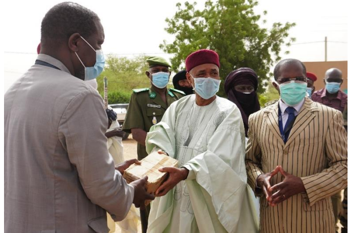
Les autorités régionales d'Agadez lors de la donation du 11 juin

Avec le soutien de l'Union européenne, l'OIM fait don aux stations de lavage des mains de la région, de savon, de matériel de sensibilisation et de désinfectant pour les mains produits localement par des étudiants de l'Université d'Agadez.