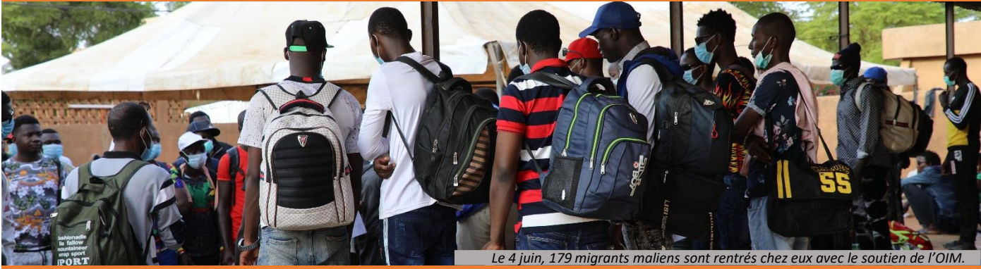
Le 4 juin, 179 migrants maliens sont rentrés chez eux avec le soutien de l'OIM.