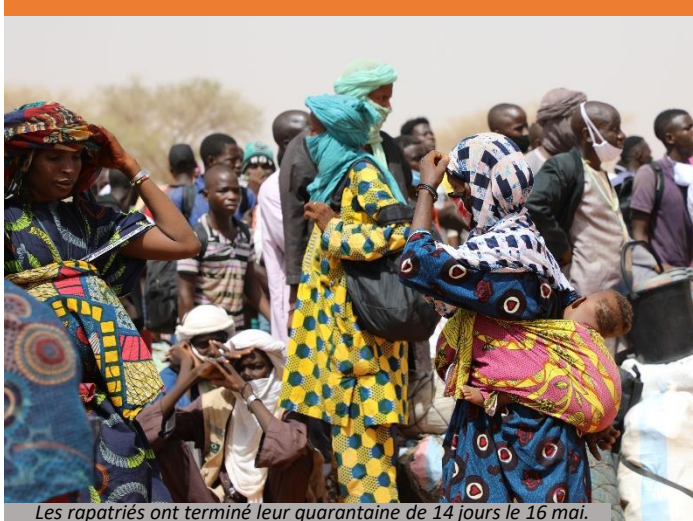
Les rapatriés ont terminé leur quarantaine de 14 jours le 16 mai.