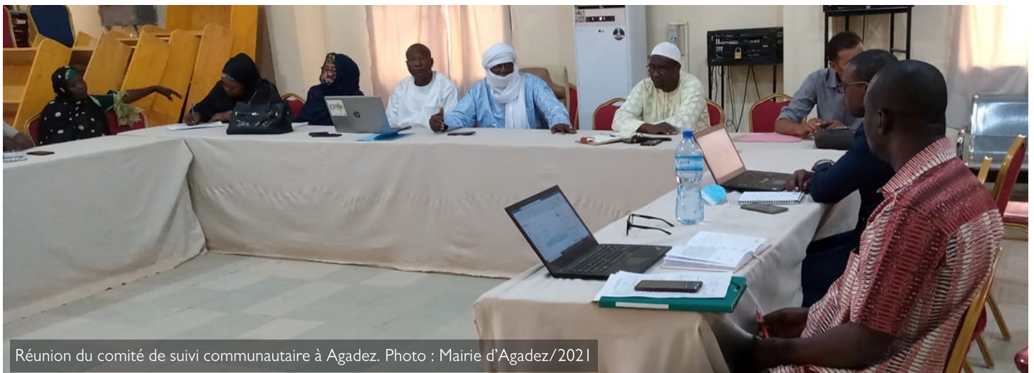
Réunion du comité de suivi communautaire à Agadez.