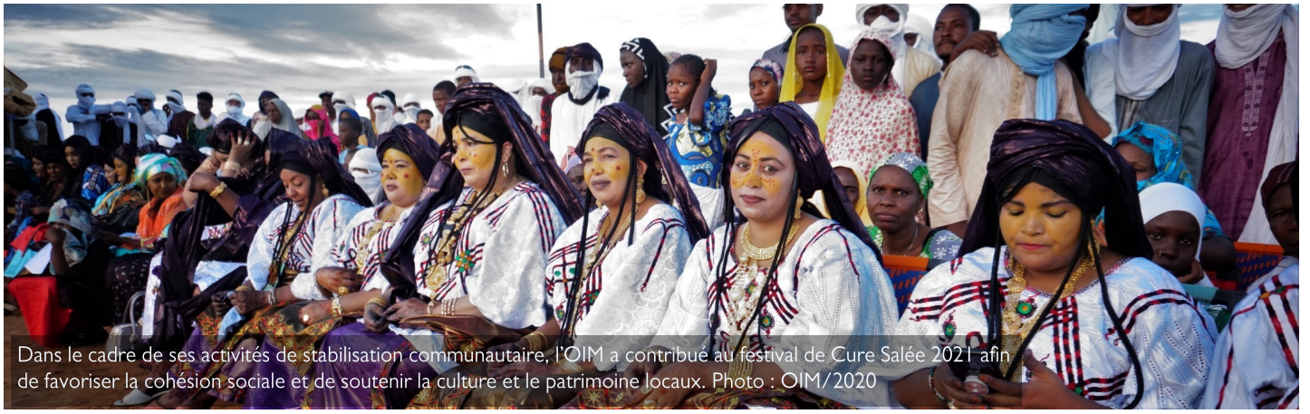
Dans le cadre de ses activités de stabilisation communautaire, l'OIM a contribué au festival de Cure Salée 2021 afin de favoriser la cohésion sociale et de soutenir la culture et le patrimoine locaux.